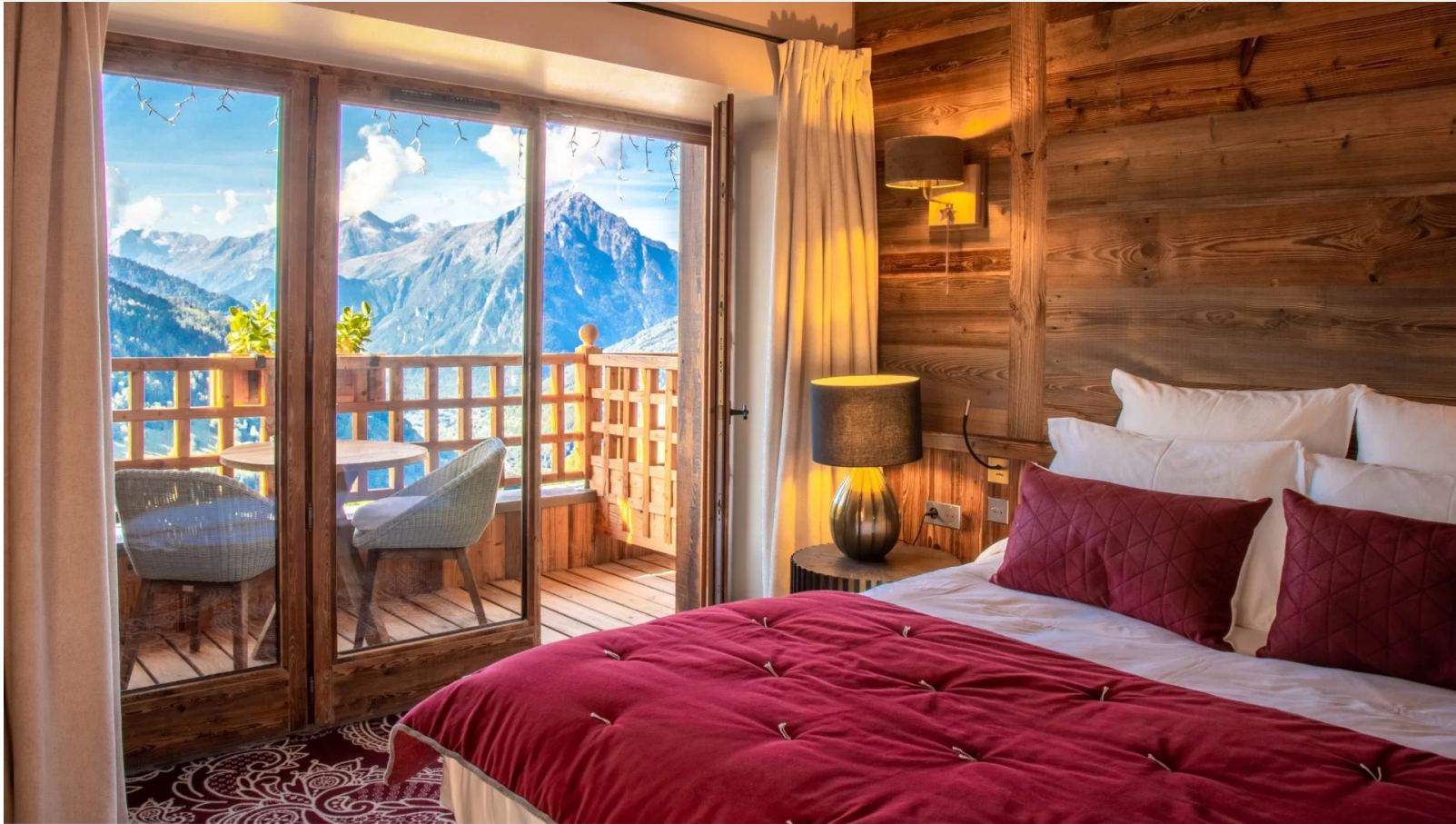
COUP DE COEUR POUR LA CHAMBRE 305 DU V DE VAUJANY, AVEC UNE VUE À COUPER LE SOUFFLE