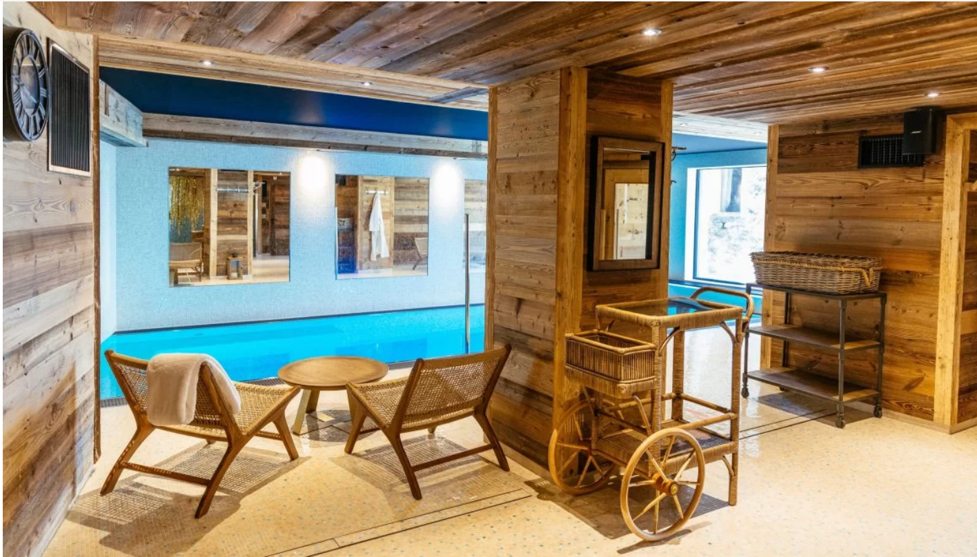
TOUJOURS AU V DE VAUJANY, ON S'OFFRE UN BREAK AU SUBLIME SPA, BULLE DE RELAXATION AU COEUR DU VILLAGE