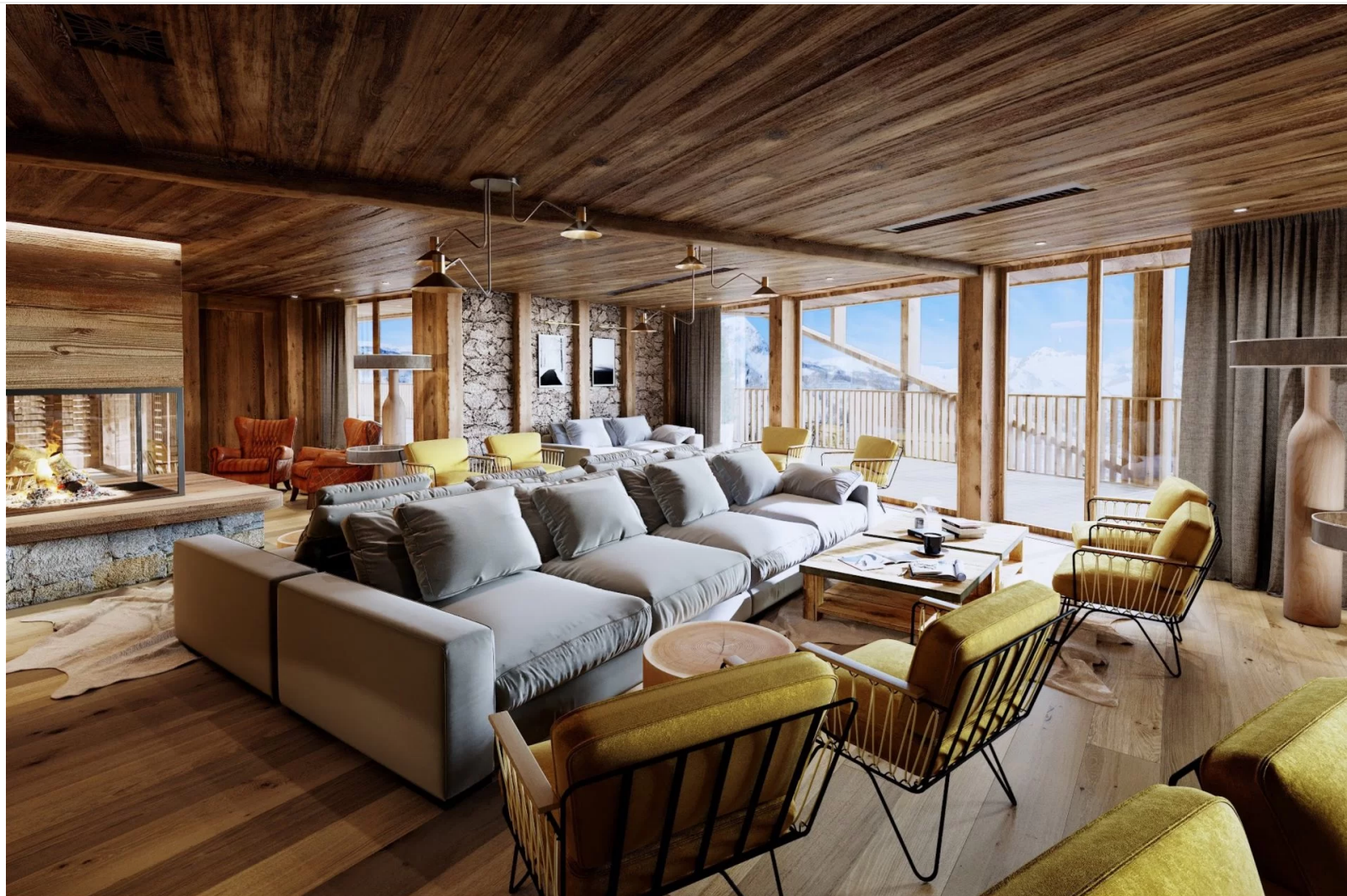
TOUT NOUVEAU, TOUT BEAU, LE LODGI NOUS FAIT CRAQUER AU COEUR DES 3 VALLÉES